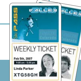
Forfaits de Ski