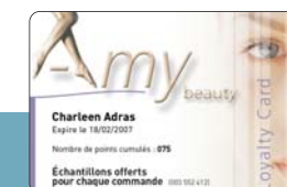
Cartes de Fidélité