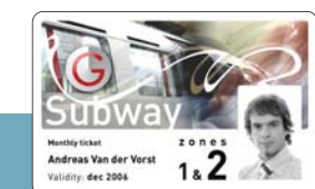
Titres de Transport